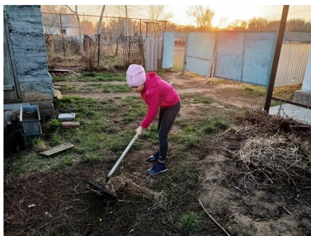
Акция «Чистая планета»

На занятиях ОБЖ были рассмотрены основные темы и понятия: