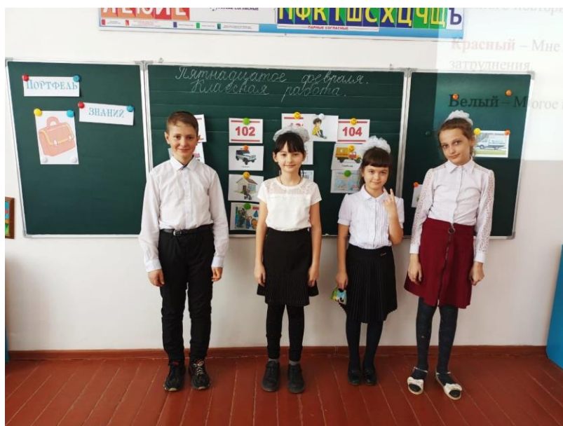
Урок познания мира

Возможные причины возникновения пожара. Оценка ситуации. Особенности горения синтетических материалов. подручные средства пожаротушения. Огнетушители, их классификация и правила пользования.