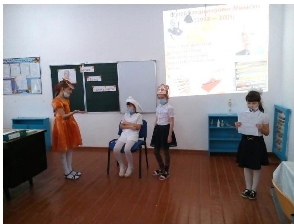
Театрализованная постановка басни С. В. Михалкова «Заяц - симулянт»

В течение учебного года были проведены классные часы , которые способствовали формированию основ безопасности жизнедеятельности: «Компьютер – друг, враг, помощник», «Злой волшебник – табак», «Этот коварный лёд», «Права ребенка – права человека», «Скажи «нет» с детских лет», «Огонь – друг или враг человека», «Семья, дорога, безопасность», «Секреты здорового питания», «Здоровый летний отдых».