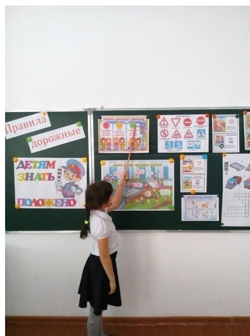
Классный час по ПДД

Неоднократно в течение года была проведена учебная эвакуация в школе . Дежурный по вахте подавал сигнал тревоги. Завхоз школы открыл запасные выходы. Преподаватели и учащиеся первого и второго этажей не растерялись, приняв правильное решение, эвакуировались быстро и без паники.